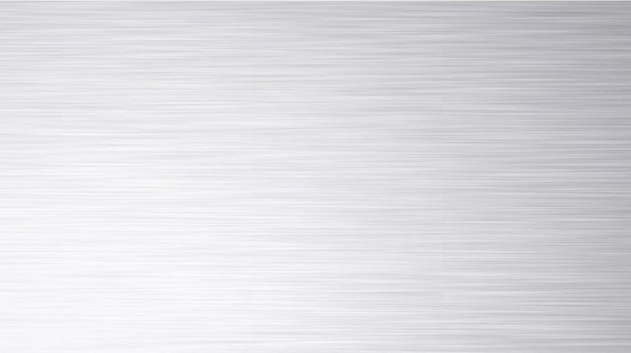
TABELLA FINITURE ANODIZZATE - ANODISED FINISHES CHART

Alluminio Anodizzato Argento Anodised Silver Aluminium