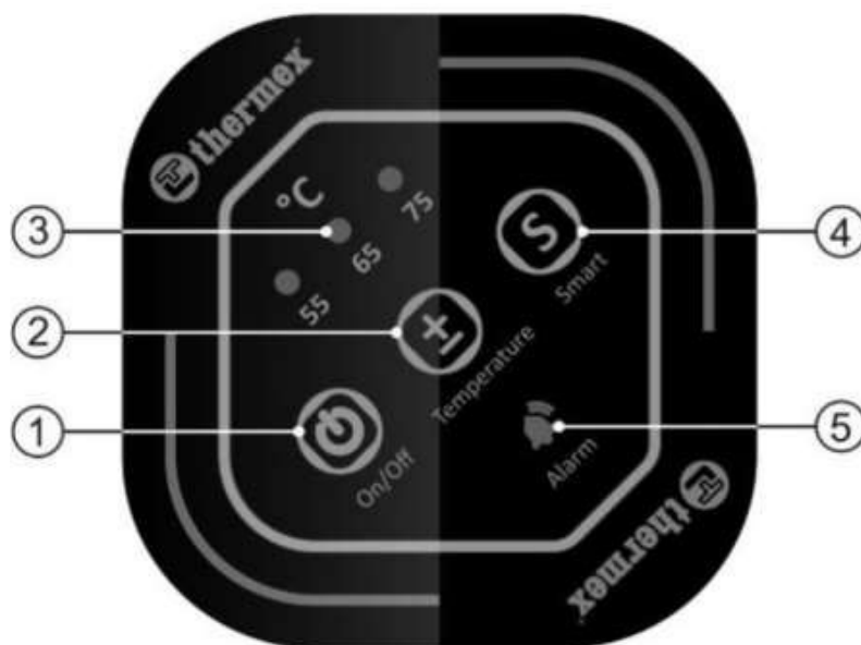
2. ábra Vezérlő panel

1 - "ON / OFF" be- / kikapcsoló gomb, 2 - "TEMPERATURE" fűtési hőmérséklet növelő / csökkentő gomb, 3 - Fűtési hőmérséklet kijelzők (55 ° C, 65 ° C, 75 ° C), 4 - "SMART" intelligens mód gomb, 5 - "Alarm" vészjelzés jelzője.