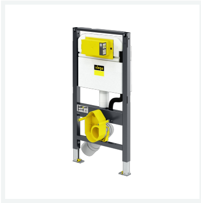
Prevista Dry WC-elem zuhany-WC-előkészítéssel 980 mm modellszám 8530 cikkszám 772 000