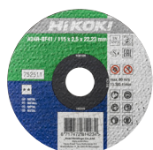
Vágótárcsa Ø115 mm, 25 db 752511

Válasszon a modell verzióinak megfelelő tartozékokat a sarokcsiszolójához, tárcsát, szénkefét, porszűrőt. A finom szűrőháló sokkal ellenállóbbá teszi a gépet a porral szemben.