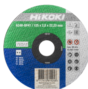
Vágótárcsa Ø125 mm, 25 db 752512