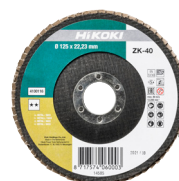
Lamellás tárcsa Ø125 mm, 10 db 4100116