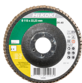
Lamellás tárcsa Ø115 mm, 10 db 4100111