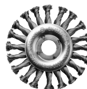
Korongkefe Ø125 mm 751302